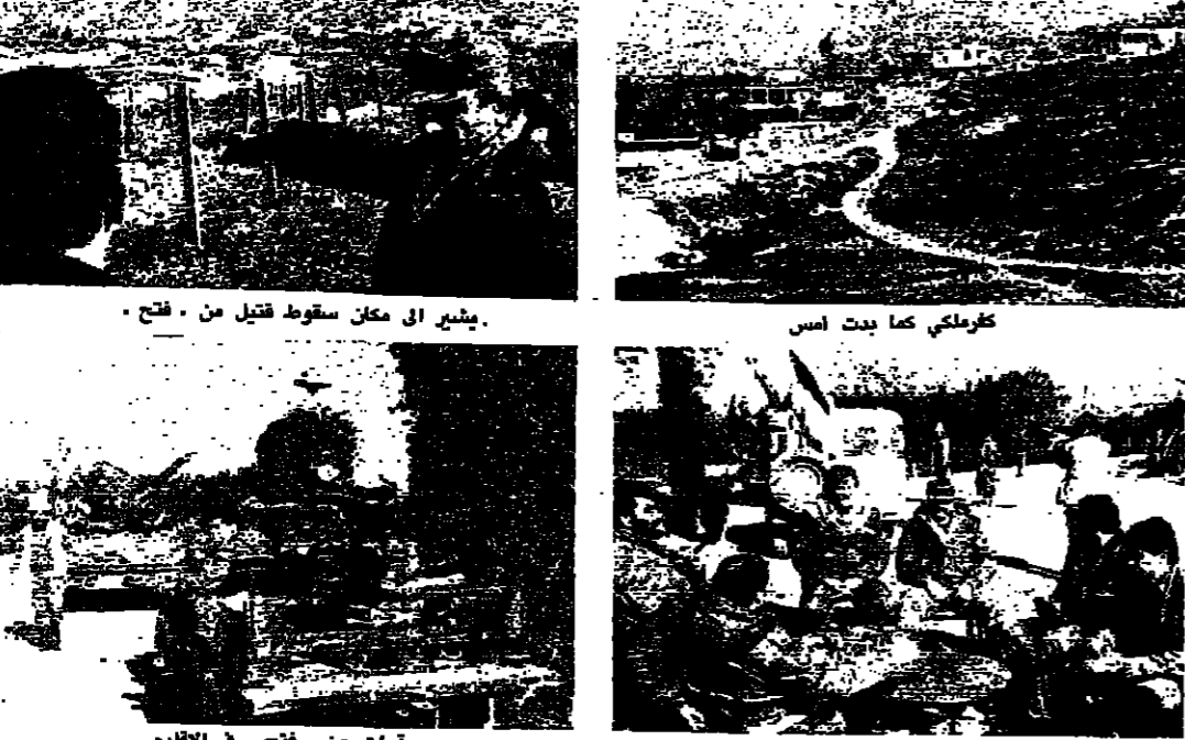
يشير الى معلن سقوط قنيل من فتح

الوضع المستعد على الساحة في الاقليم والتفاح وخاصة بعد الاعتداءات التي تعرضت لها قوات الفصل بين الله وحركة... وفتح وجهتنا اندزا الى كل من يتعرض لحوادثنا